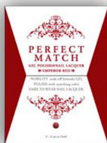
Ярко - Красный PMS03