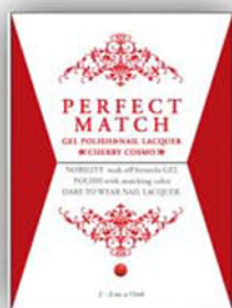
Ярко - Вишневый PMS01