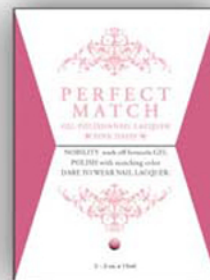
Нежно -Розовый PMS05